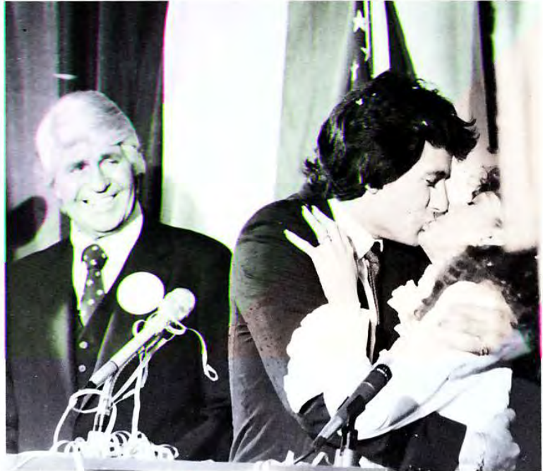
1980: Der Senator küßt seine Frau, Jock strahlt. Hätten Bobby und ich doch nur mehr Zeit mit Küssen zugebracht als damit, auf andere Leute zu hören, denkt Pamela später wehmütig, vielleicht hätten wir dann unsere Ehe gerettet.

Aber Pamela hatte ja Bobby. Morgens wachte sie in seinen Armen auf, abends schlief sie in seinen Armen ein, sie richteten sich ihr Leben ein und machten Pläne für die Zukunft. Das machte alles andere wett.