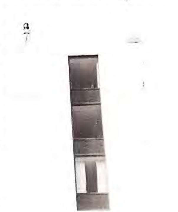
1981: Pam hat einen Nervenzusammenbruch erlitten und will sich vom Dach des Reunion Tower stürzen.

Im Jahre 1980 starb Digger eines langsamen und schmerzhaften Todes. Pam litt unter dem Verlust. Die schreckliche Einsamkeit trieb sie dazu, Nachforschungen über ihre Mutter anzustellen. Irgendwie hatte sich der Gedanke in ihr festgesetzt, daß sie vielleicht noch am Leben war, ein aus Kummer geborener Traum, der aber in Erfüllung gehen sollte, denn ein Privatdetektiv