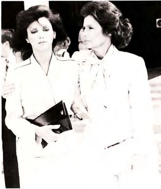
1981: Pamela verläßt mit ihrer Mutter die Arztpraxis, nachdem sie erfahren hat, daß sie keine Kinder bekommen kann.

Ein Glück für Pam, daß Bobby immer an ihre Unschuld glaubte und auch diesmal keine Ausnahme machte, aber der Zwischenfall gab Pams Haß auf J. R. neuen Auftrieb.